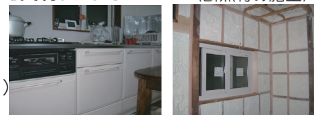
事例工事合計 120万円

●台所改修工事実例紹介 台所が寒いので何とかしたい、収納力を増やしたい、と相談を受けました。床・壁・天井に断熱材を入れ、勝手口をふさぎ収納庫を設け、システムキッチン・換気扇を新しくし、暖かく・快適な台所を実現しました。 <断熱材の施工>