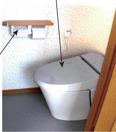
収納棚の下地造り