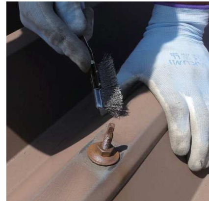
ワイヤーブラシでの錆取り