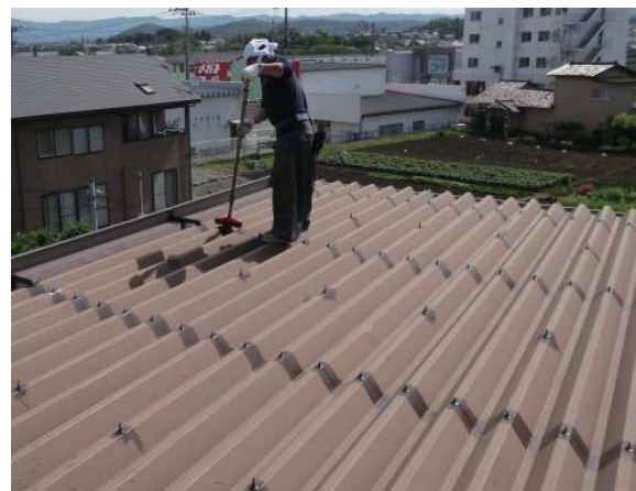
←③ 屋根全体の清掃作業中