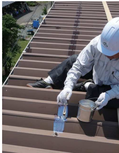
←② 専用錆止め塗料（サビパンチ）の施工中

ボルトの錆に関しては、錆取りをして、そのみの錆止め塗装をすることを提案しました。