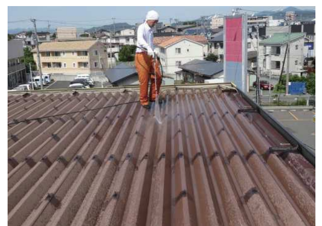
④ 清掃作業後に水洗い →