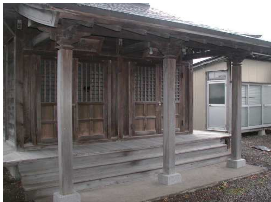
【工事前の上堂観世音のお社】