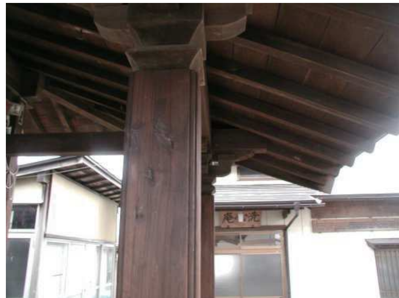
【修復後の柱の状況】

害虫処理業者と共に、柱廻り、木材の腐食状態、柱の強度などの点検をしました。その結果、柱周りに木の粉がないので、蟻など虫によるあけ方ではないと判断、また、叩いてみて、硬い音しかしないので柱内部までの被害はないと判断しました。穴の状況を見て、キツツキなどの鳥によるものと判断しました。