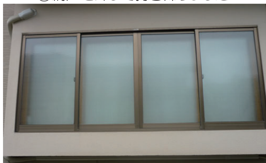
③加工場で張り直した網戸を窓に取付け