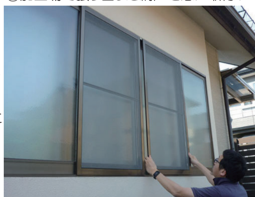
④グラスファイバー防虫網戸の取付け終了