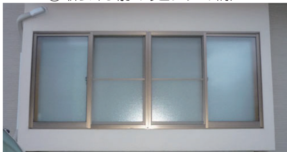
②網戸を外して持ち帰りました。